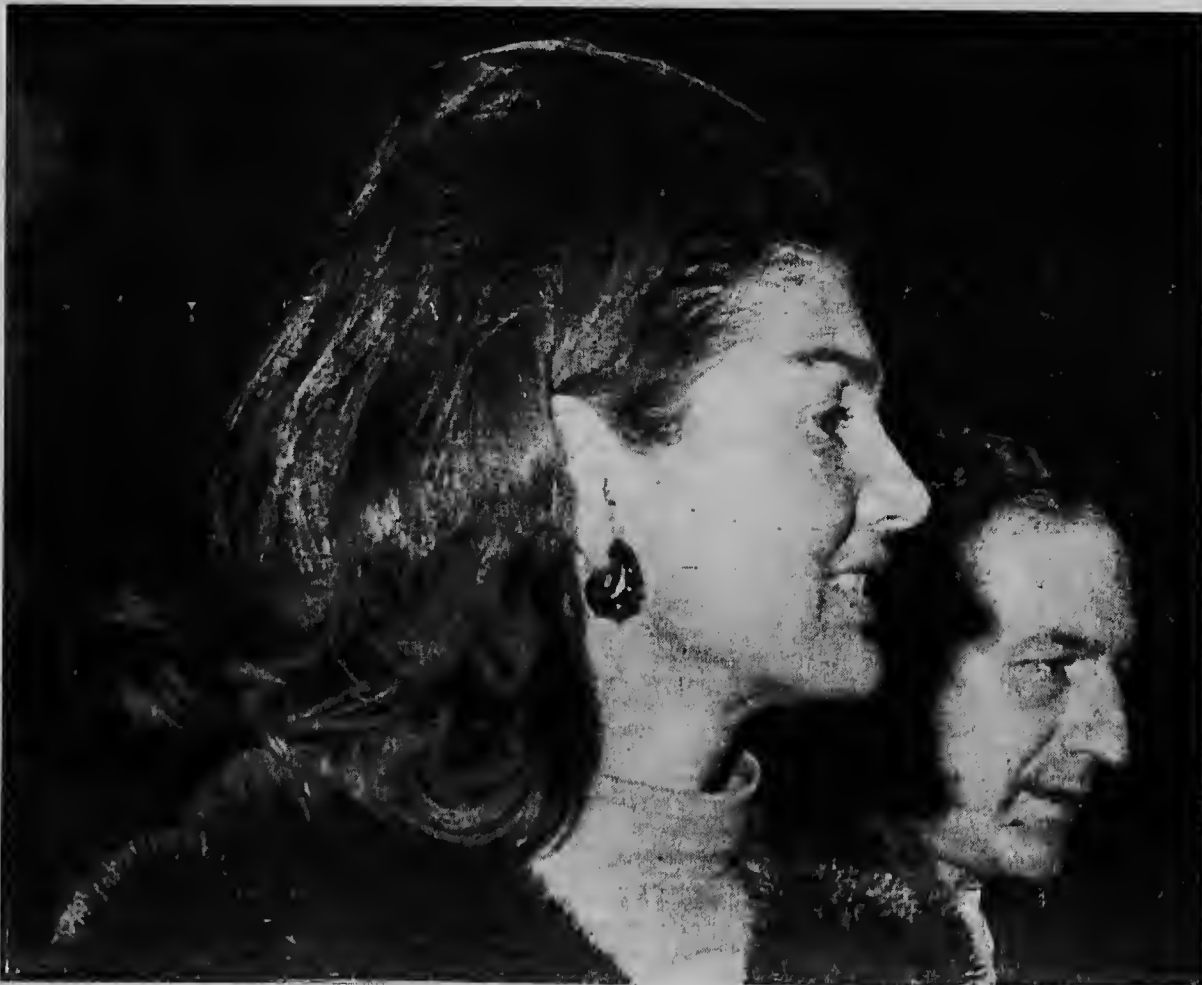
Acompaña pa un homber desconoci, senjora John F. Kennedy aki ta bandonando e teater di Ethel Barrymore na New York despues di a asisti na un actuacion di Les Ballets africains, e grupo di baile di Re publica di Guinea

Refiriendo ne asunto di A.G. Leventics, den cual propiedadnan di e firma a ser cumpra pa Gobierno, pa un prijs di 16 millon 800 mil dollar na lugar di 14 millon, cu ta loke nan bal, e informe a bisa cu parti di e placa cu no a ser recupera di Nkrumah